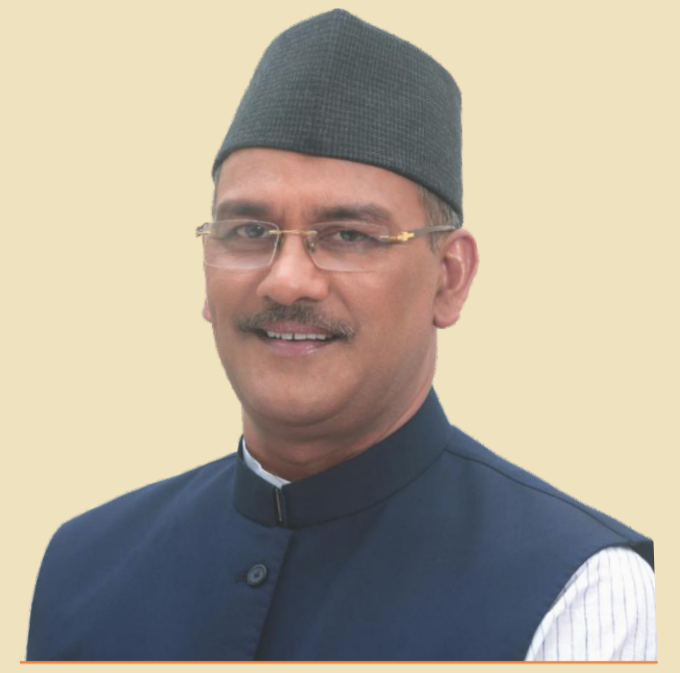
त्रिवेन्द्र सिंह रावत मुख्यमंत्री