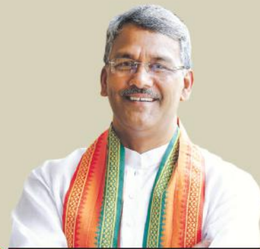
त्रिवेन्द्र सिंह रावत मुख्यमंत्री, उत्तराखण्ड